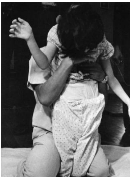
↑ 胎児性水俣病患者

水俣病はメチル水銀に汚染された魚や貝を食べることによって起こったメチル水銀の中毒症です。つまり、空気や体に触れることでうつる伝染病ではありません。また胎児性水俣病は妊娠中のお母さんが、メチル水銀に汚染された魚や貝を食べ、メチル水銀がお母さんの胎盤を通して赤ちゃんに入ってしまう水俣病になりました。遺伝もしません。